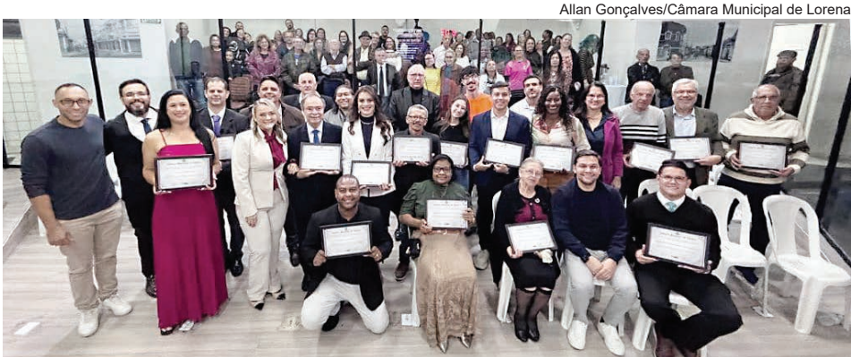
Allan Gonçalves/Câmara Municipal de Lorena