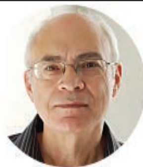
*Mestre em Filosofia pela USP. Membro da APCA - Associação Paulista de Críticos de Arte. Autor de "Um Passeante pelas Mostras de Arte: Ensaios Críticos", Editora Penalux. Escritor e ensaísta. waddeo@uol.com.br

Por isso, as eleições de outubro serão as mais difíceis e as mais polarizadas desses tempos. Não verdade, será a democracia que estará em jogo.