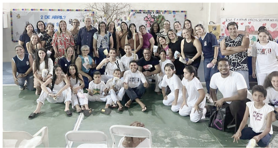
Uma noite de muitas informações e testemunhos, marcou o evento

“Autismo não é tudo igual... Cada pessoa no espectro é única... Com formas diferentes de sentir, se comunicar e interagir... Alguns sinais podem aparecer na infância: atraso na fala; dificuldade de interação; comportamentos repetitivos. O diagnóstico precoce pode fazer toda a diferença no desenvolvimento. Mas o mais importante é ter compreensão e cuidado.”, diz texto em postagem nas