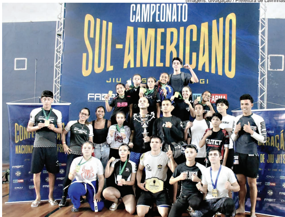
Projeto de jiu-jitsu de Lavrinhas conquista 2º lugar geral em Sul-Americano II