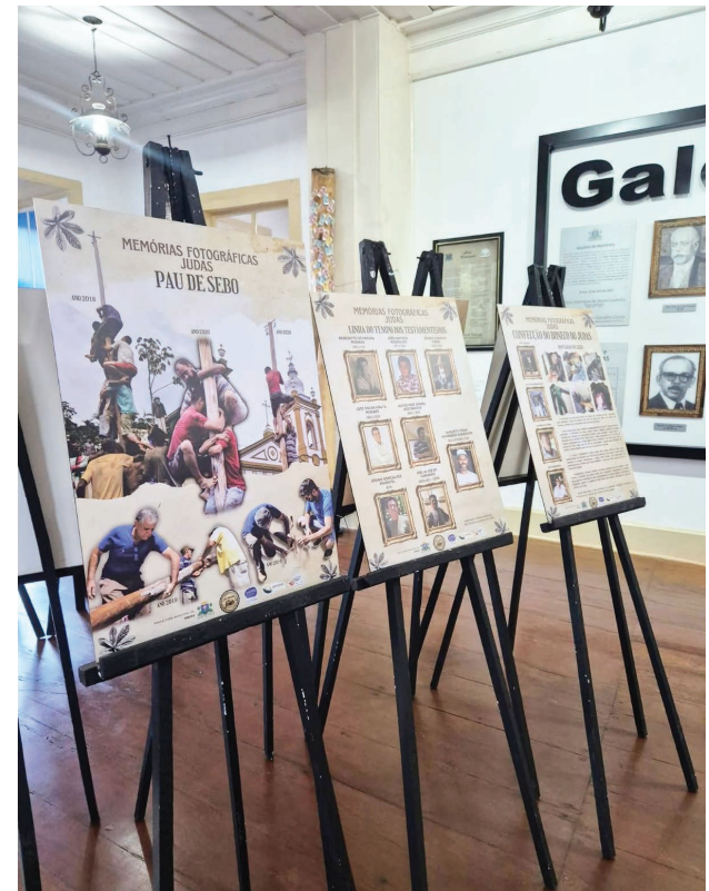
Parte da exposição