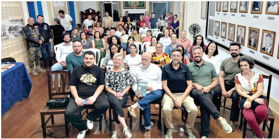
Casa da Cultura ficou lotada

Escritora e guardiã de um legado que atravessa