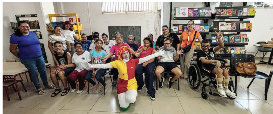
Evento acontecerá uma vez por mês