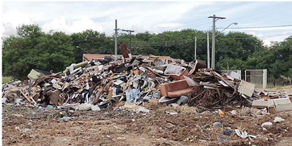
PEV tem causado transtornos

A ampla adesão reforça que o fechamento do PEV CECAP deixou de ser pauta isolada e se tornou reivindicação coletiva do Legislativo, em resposta ao clamor dos moradores por uma solução definitiva.