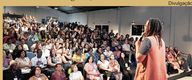
Evento no Teatro Tereza D'Ávila teve participação massiva