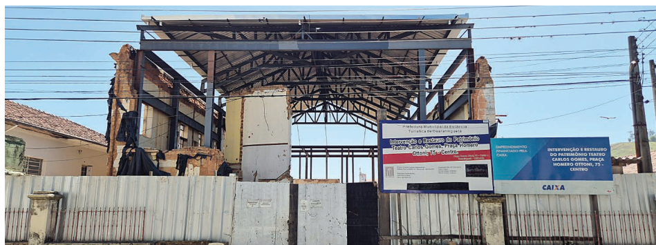
Fachado do antigo Teatro Carlos Gomes após desabamento em 2023; foto em 21-11-25