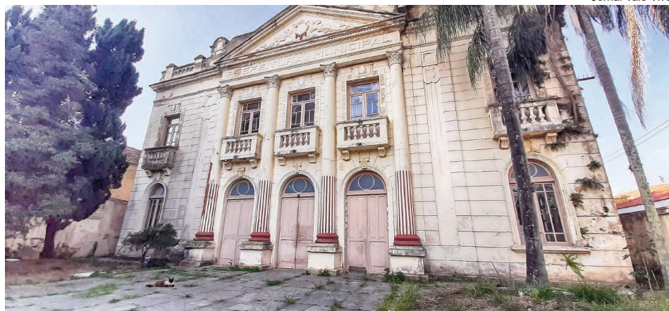
Fachado do Teatro Carlos Gomes em foto registrada em 2021