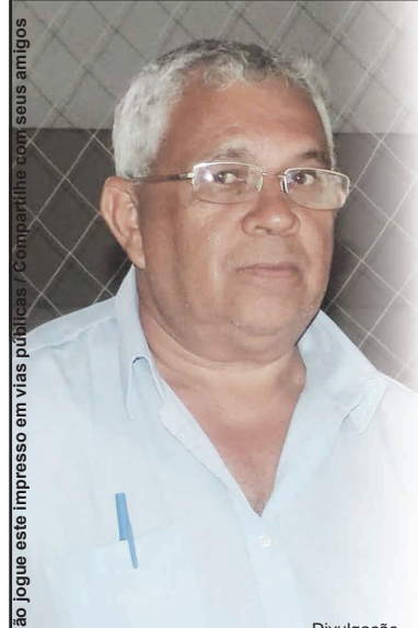
Não jogue este impresso em vias públicas. Compartilhe com seus amigos