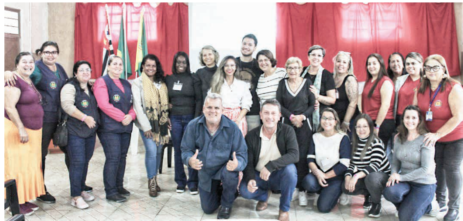
Conferência reuniu autoridades e idosos da comunidade no Centro Comunitário

A realização de uma Conferência Municipal da Pessoa Idosa é de extrema importância, pois cria um espaço democrático de escuta, diálogo e construção de propostas voltadas às necessidades e aos direitos dessa parcela da população. Por meio da participação ativa de idosos, gestores públicos, conselhos e a sociedade civil, é possível discutir políticas públicas mais justas, garantir a efetividade do Estatuto do Idoso e fortalecer ações que promovam o envelhecimento com dignidade, respeito e