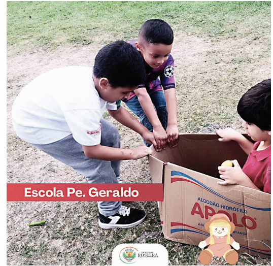
Escola Pe. Geraldo