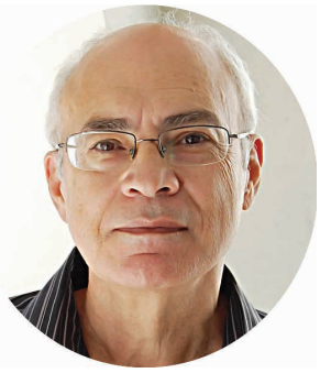
*Mestre em Filosofia pela USP.

Os evangelistas, Mateus, Marcos e Lucas registraram na Bíblia cristã a famosa parábola do camelo e do buraco da agulha onde se diz que dificilmente um rico e poderoso irá para o céu. No Brasil, completamos a parábola. Não irão nem ao céu, nem à prisão para cumprir suas penas.