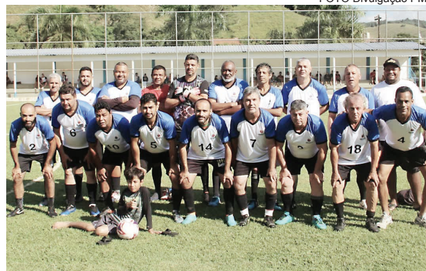
Equipe vice-campeã, Veteranos

final, foi realizado um sorteio entre as equipes derrotadas, sendo