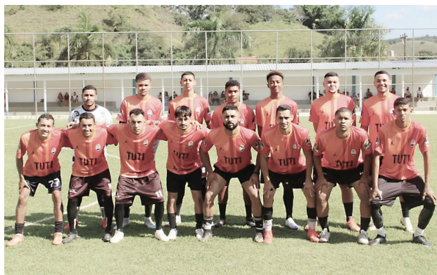
Equipe campeã, Força Jovem

tória do Beco Para definir o quarto representante da semi-