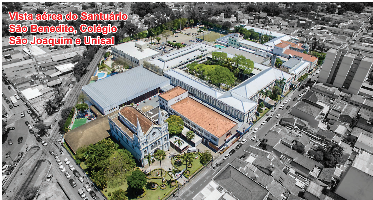
Vista aérea do Santuário São Benedito, Colégio São Joaquim e Unisal

Consolidando-se como referência acadêmica e humana na formação de milhares de alunos ao longo de décadas. Desde sua fundação em 1889, a instituição salesiana tem sido um pilar da educação lorensense, mantendo-se fiel à missão de formar jovens com conhecimento, valores cristãos e compromisso com a sociedade.