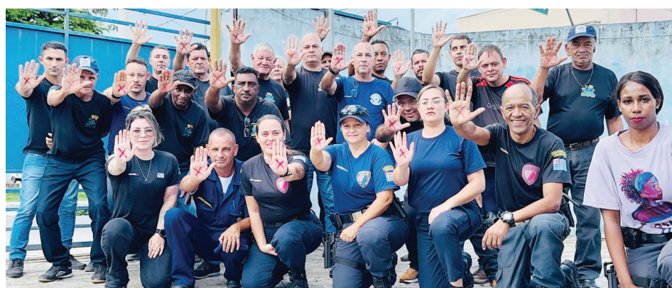
Guardas Civis Municipais após treinamento e sinalizando com o X na palma da mão, referência ao sinal de emergência para denunciar violência doméstica

Durante a formação foram abordadas várias matérias de suma importância para a capacitação técnica dos