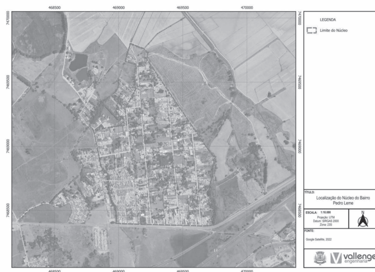
Figura 1 – Localização da área de estudo

A área contemplada nesta Reurb está inserida nas Matrículas nº 9431/96; 9434/96; 9435/96; 9436/96; 9437/96; 9438/96; 9512/96; 9513/96; 9514/96; 9515/96; 9516/96; 9557/96; 9558/96; 9584/96; 9662/96; 9663/96; 9664/96; 9665/96; 9666/96; 9667/96; 9668/96; 9669/96; 9693/96; 9694/96; 9695/96; 9697/96; 9698/96; 9699/96; 9700/96; 9701/96; 9702/96; 9703/96; 9704/96; 9705/96; 9706/96; 9707/96; 11715/02; 11716/02, registradas no Oficial de Registro de Imóveis da Comarca de Aparecida, podendo ser identificadas e compreendidas por meio da imagem a seguir: