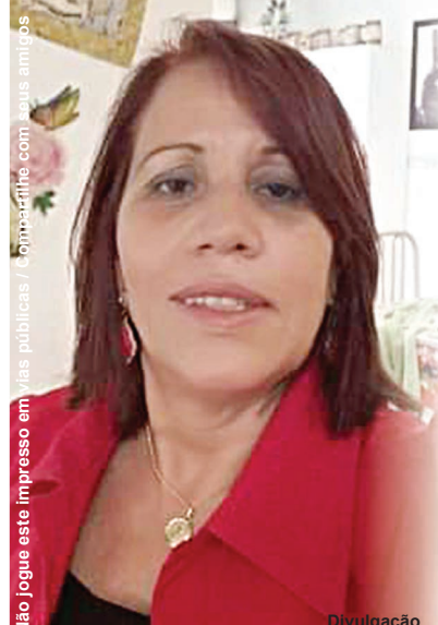
Não jogue este impresso em vistas publicas / L'ompartilhe com seus amigos