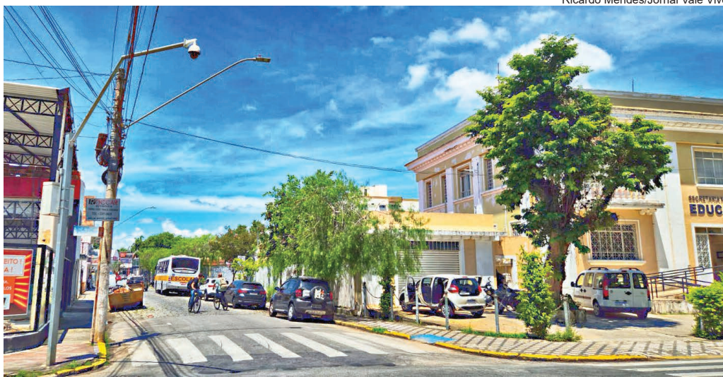
Ricardo Mendes/Jornal Vale Vivo

Júnia Botelho Homenagem Jornal Vale Vivo