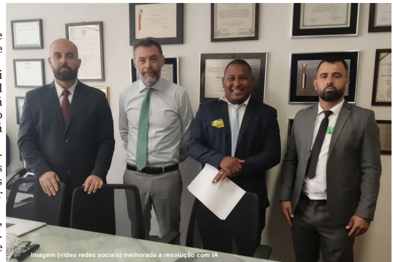
Imagem (vídeo redes sociais) melhorada a resolução com IA

Deputado, nossa gratidão por toda atenção, carinho e compromisso com o nosso povo. Seguimos trabalhando, com os pés no chão e pensando sempre na nossa gente!"