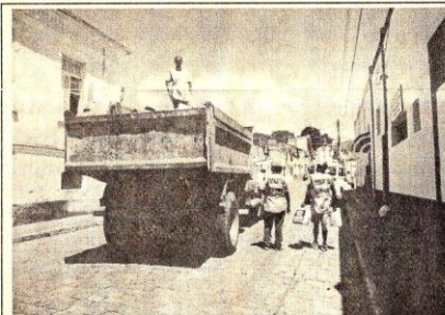
Três catadores de lixo recolhem o material reciclável no primeiro dia de coleta

primeiro dia de coleta seletiva de lixo em Cachoeira. O sistema de coleta seletiva de lixo - uma parceria entre Prefeitura e Comunidade Emaús - começou quarta-feira, dia 1º, em 49 ruas e praças do