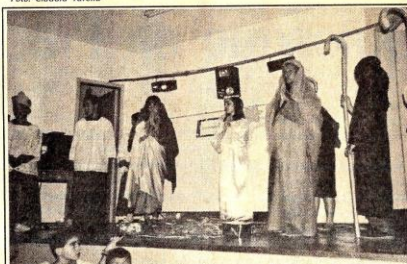
Alunos do Educandário encenaram um presépio vivo naquela escola dia 30