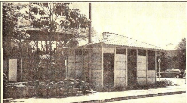
O arquiteto Yan Lorena, mesmo sendo contra, aprovou a construção, mas considerou que o quiosque "ficou horrível"