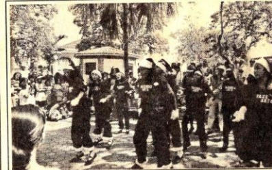
MANHÃ DE LAZER - Com os personagens do Sítio do Pica-Pau Amarelo, o grupo teatral "Fazendo Arte", de Cruzeiro, divertiu crianças na manhã de domingo, dia 28, na Praça Prado Filho. Ele apresentaram a peça "Pirilimpitimpim" e fizeram brincadeiras com as crianças, como a da estátua e um concurso de dança.