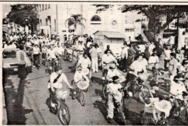
Com bicicletas enfeitadas, estudantes participam de passeio ciclístico pela cidade