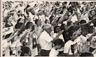
Fieis lotam Rincão do Senhor, na Canção Nova, para rezar com o padre indiano