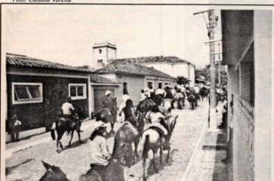
Com mais de 300 cavaleiros, desfile da tropa passa por ruas no centro de Silveiras