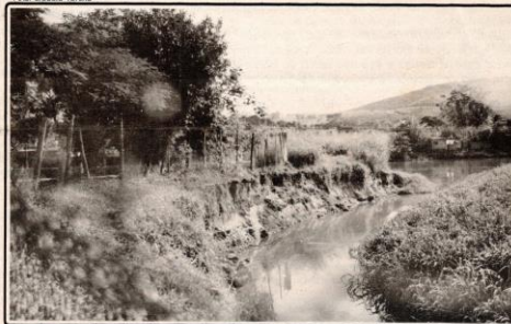
EROSÃO - O caminho de passagem entre a rua Carlos Pinto e a rua Silva Caldas (rua em frente à Quadra Cobera) está em processo de erosão. O local margem o Parque Ecológico Nelson Lorena, que teve seu alambrado recuado para que a erosão não o derrubasse. O "caminhinho", como é vulgamente conhecido, era usado pelos pedestres como atalho entre o centro da cidade e o bairro da Margem Esquerda.