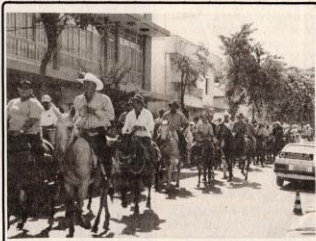
Cavaleiros de trinta cidades saíram de Cachoeira rumo a Aparecida