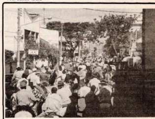
Romaria parou na Igreja de São Sebastião para receber bênção