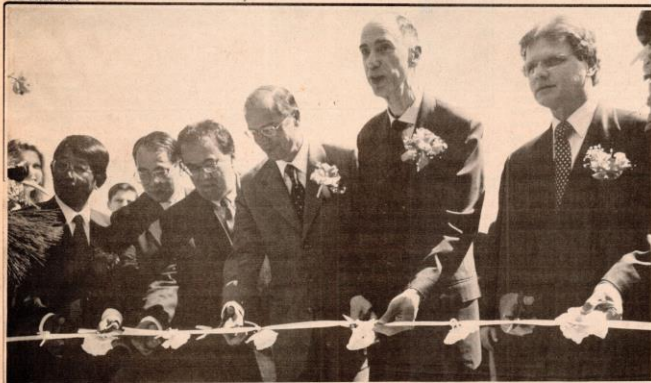
Fita simbólica de inauguração da fábrica da Yakult, em Lorena, foi cortada por Aloísio Vieira, Geraldo Alckmin e Marco Maciel, entre outros