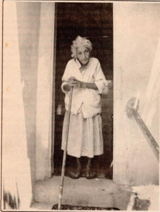
Com 101 anos, ela ainda sai ao quintal para cuidar de galinhas