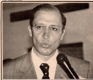
O vice-governador reafirmou seu empenho na restauração da Estação