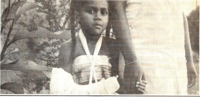
Ingrid quebrou o braço e sua mãe diz que houve negligência médica no Pronto-Socorro, mas Santa Casa alega que atendimento foi adequado

Por Claudia Varella e Jurandir Rodrigues