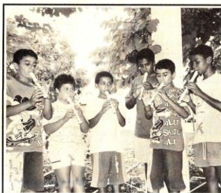
Aula de música faz baixar agressividade de crianças, na Casa do Amigo

Com poucos recursos mensais (R$ 350), a Casa do Amigo vive de doações e de contribuições de associados. A casa onde está instalada foi cedida pela MRS por cinco anos. A entidade recebe ajuda ainda do Clube de Mães do Brasil.