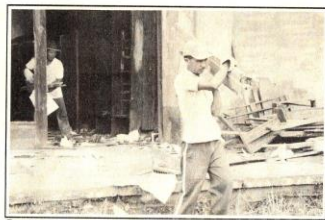
Funcionários municipais iniciam a limpeza do prédio, para a restauração