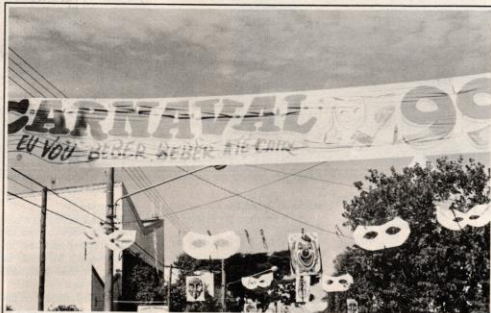
De gosto duvidoso, a decoração de rua do carnaval foi colocada dia 10 em um trecho da av. Cel. Domiciano

Segundo alguns foliões, não existe na cidade "um clima de carnaval". Contribui para a expectativa pessimista o êxodo de cachoeirenses para o litoral. Muitos no entanto apostam no espírito carnavalesco dos cachoeirenses.