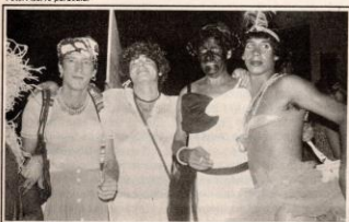
No apogeu dos blocos sujos, foliões vestidos de mulher (1922)