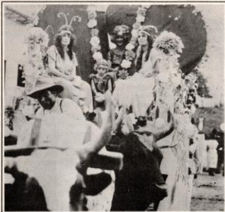
Nos anos 20, alegorias eram montadas até em carro-de-boi