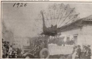
A elegância dos foliões, de terno, refletia a imponência do pavão