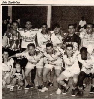
Pela 2ª vez na final do campeonato, Juventude é o campeão do Futsal