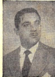
Prefeito Municipal Erasmio Pompéia Pinto

Terá lugar hoje às 20 horas, a solene inauguração do jardim público ora completamente remodelado, que se localiza à Praça Prefeito Prado Filho e constitui sem dúvida a mais bela realização da atual administração do município.