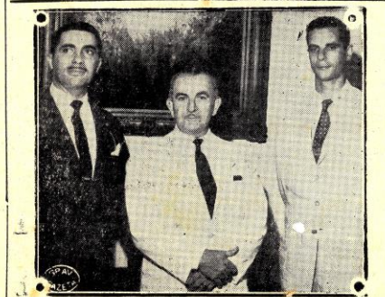
Na foto: Os Prefeitos de Cachoeira Paulista, Cruzeiro e Lavrinhas.