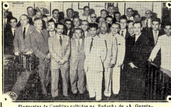
Flagrantes da Comitiva colhidos na Redação de «A Gazeta».

Reportagem de Manoel Alves Barbosa. Para «O Cachoeirense»