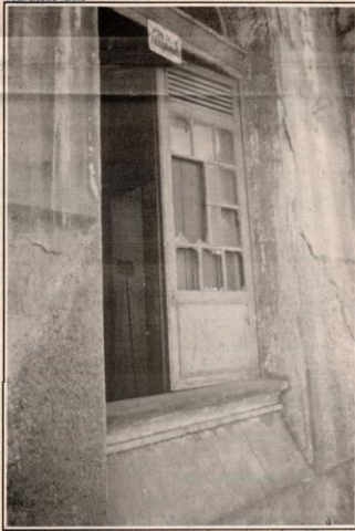
Vandalismo já destruiu portas, janelas e vidraças do prédio