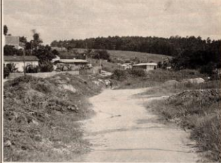
Entulho amontado nas margens do córrego estreita rua do loteamento