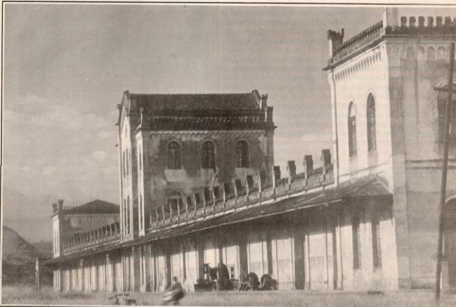
Estação Ferroviária de Cachoeira, o maior patrimônio ferroviário do eixo Rio-São Paulo, está em ruínas, com pouca chance de ser recuperado.