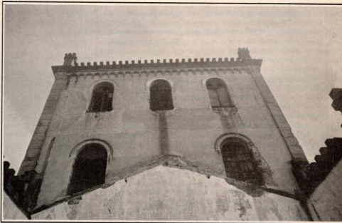
Parte do telhado da estação já desabou, o restante está escorrido com lâmbas, com risco de desabamento