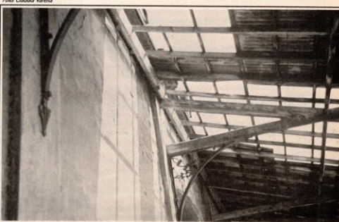
Com telhas quebradas e madeiramento podre, o telhado das plataformas pode desabar a qualquer momento