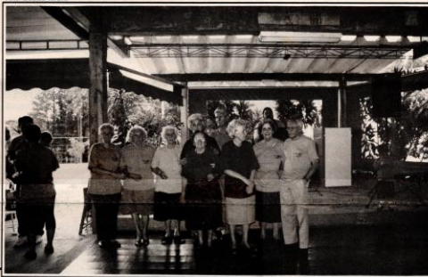
Festa da família Nogueira, sábado, na ADC do INPE, reuniu desde irmãos a tataranetos

Cerca de 250 integrantes da família Nogueira se reuniram sábado, dia 26 em festa na ADC do INPE, em Cachoeira Paulista. Cada ramo da família vestia uma camiseta de um cor. A festa colorida reuniu a família de dez irmãos Nogueira, com filhos, netos, bisnetos e até tataranetos.