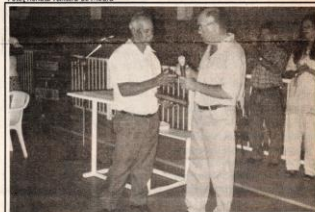
Prefeito entrega prêmio a funcionário que mais se destacou em 98