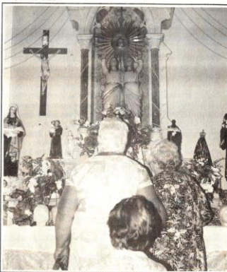
Altar de Santa Cabeça, todo de mármore, é raridade da região