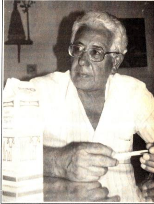
Claudomiro diz que unificação das marcas de leite é vantajosa