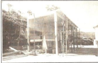
Fonte de água benta, em construção, terá seis bicas para os fiéis