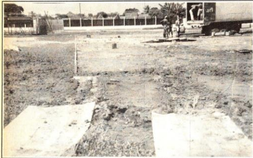
O campo de futebol do estádio municipal fica destruído após o término do 1º Cachoeirão Rodeio