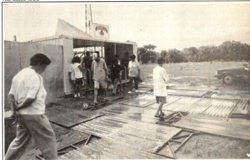
Chuva e lama causaram transtornos ao Rodeio, que teve público abaixo do esperado