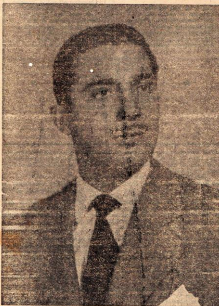
Prefeito Erasmo Pompeia Pinto

Embora de um modo lento, forçado por circunstâncias adversas, porém gradativamente, em etapas progressivas, a atual administração deste município, conduzida pelo sr. Erasmo Pompeia Pinto, está efetuando uma completa reforma no jardim da Praça Prefeito Prado Filho, principal logradouro público desta cidade. Ficou terminado o novo serviço de iluminação do jardim, feita por condutos subterrâneos, postes de ferro fundido e unidades de vidro alabastrino corrugado, de fabricação da General Electric, em lâmpadas de 360 watts por aproximadamente 600 velas por coluna. Trata-se de um serviço excelente, digno de todos os elogios, que muito recomenda o gosto e o bom senso do nosso atual Prefeito. Até hoje ainda não foi feito um globo menor do que o Nivalux, empregado na atual reforma do novo jardim e ch. efênt: a sua perda máxima de luz por absorção é apenas de 5 por cento, enquanto nos globos comuns leitosos esta perda atinge 30 por cento da capacidade iluminativa. Nem mesmo a moderna iluminação fluorescente para logradouros públicos leva vantagem sobre o sistema incandescente com globos Nivalux. São estes usados e preferidos nas principais cidades dos Estados Unidos e do Brasil, como nas grandes Capitais brasileiras: Rio de Janeiro, São Paulo, Belo Horizonte e outras. A atual administração do município lavrou um tanto e conseguiu uma expressiva vitória. Depois de iluminado o novo jardim oferecerá belíssimo aspecto noturno. Sob o ponto