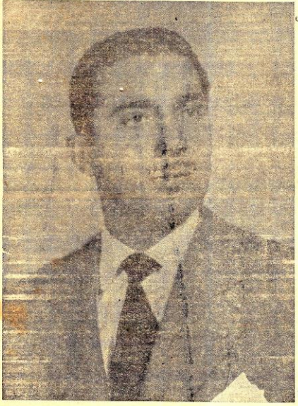
Prefeito Erasmo Pompeia Pinto

Embora de um modo lento, forçado por circunstâncias adversas, porém gradativamente, em etapas progressivas, a atual administração deste município, conduzida pelo sr. Erasmo Pompeia Pinto, está efetuando uma completa reforma no Jardim da Praça Prádo Filho, principal logradouro público desta cidade. Ficou terminado o novo serviço de iluminação do jardim, feita por condutos subterrâneos, postes de ferro fundido e unidades de vidro alabastro corrugado, de fabricação da General Electric, com lâmpadas de 300 watts aproximadamente 600 velas por coluna. Trata-se de um serviço excelente, digno de todos os elogios, que muito recomenda o gosto e o bom senso do nosso atual Prefeito. Até hoje ainda não foi feito um globo menor do que o Nivalux, empregado na atual reforma do novo Jardim Cachoeirense; a sua percentagem máxima de luz por absorção é apenas de 5 por cento, enquanto nos globos comuns leitossos esta percentagem atinge 30 por cento da capacidade luminativa. Nem mesmo a moderna iluminação fluorescente para logradouros públicos leva vantagem sobre o sistema incandescente com globos Nivalux. São estes usados e preferidos nas principais cidades dos Estados Unidos e do Brasil, como nas grandes Capitais brasileiras: Rio de Janeiro, São Paulo, Belo Horizonte e outras. A atual administração do município lavrou um tanto e conseguiu uma expressiva vitória. Depois de iluminado o novo jardim oferecerá belíssimo aspecto noturno. Sob o ponto