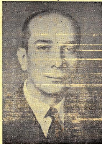
Deputado Ulisses Guimarães