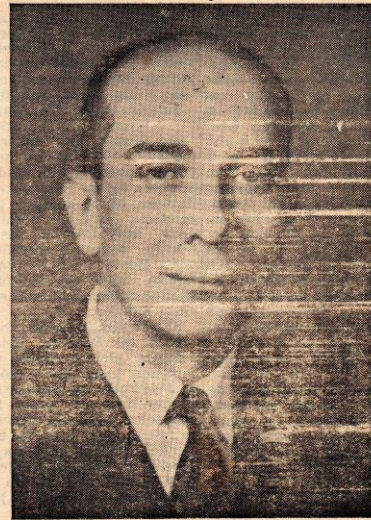
Deputado Ulisses Guimarães