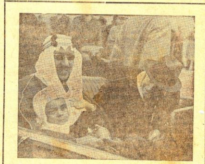
O Rei Saud, da Arabia Saudita, recebeu uma honraria rara ao chegar recentemente à capital norte-americana para iniciar uma visita oficial. Foi esta a primeira vez que o Presidente Eisenhower se dirigiu ao Aeroporto Nacional de Washington para dar pessoalmente as boas vindas a um governante ou estadista. Na foto, Eisenhower e o Rei Saud, com o Príncipe Masfud, de 3 anos e meio, deixam o Aeroporto na limusine conversível do Presidente para irem à Casa Branca. Cerca de 100.000 pessoas presenciaram a chegada dos visitantes reais.